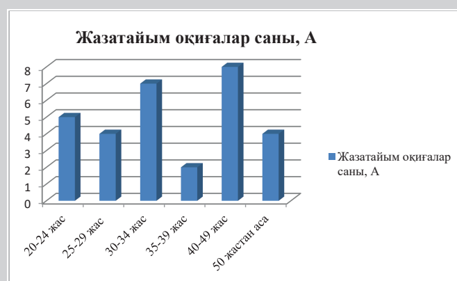
Сурет 5. 2015-2023 ж.ж. кезеңінде зардап шеккендерді жасына қарай бөлудің гистограммасы.

Кестеде келтірілген деректерді талдаудан келесідей қорытындылауға болады. Қызметкерлердің ең көп саны, атап айтқанда 27% және 23,3% «40-49» және «30-34 жас» санаттарына жатады. Бұл жұмысшылар, жұмыс өтіліне қарамастан, жарақаттануға ең бейім. Жарақаттануға бейімділігі бойынша үшінші орында «22-24 жас» жас санатындағы қызметкерлер тұр, олар жалпы санның 16,66% құрайды. «50 жастан жоғары» және «25-29» 13,3% құрайды. 1 жылдан 3 жылға дейінгі (27%) жұмыс өтілі бар жұмысшылар арасында 20-24 жас санатындағылардың (8 жағдайдың 4-і) жарақаттану ықтималдығы жоғары, 13,5% құрайды. Сондай-ақ, жарақаттанудың жоғары бейімділігі 3-5 жыл және 5-9 жыл жұмыс өтілі бар қызметкерлер арасында байқалады, бұл әр санат үшін 23,3% құрайды.