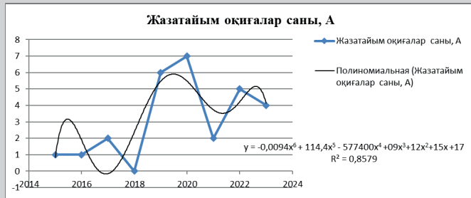
Сурет 1. Зерттелетін кезеңдегі жазатайым оқиғалар саны көрсеткішінің тәуелділік графигі.

Figure 1. Dependence of the distribution of the number of accidents on the gas station for the period from 2015 to 2023.