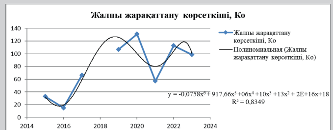
Сурет 4. Жалпы жарақаттану көрсеткішінің K_o(y) зерттеу уақытына T(x) тәуелділігінің графигі.

Рис. 3. График зависимости коэффициента тяжести K_m(y) от времени исследований T(x) .