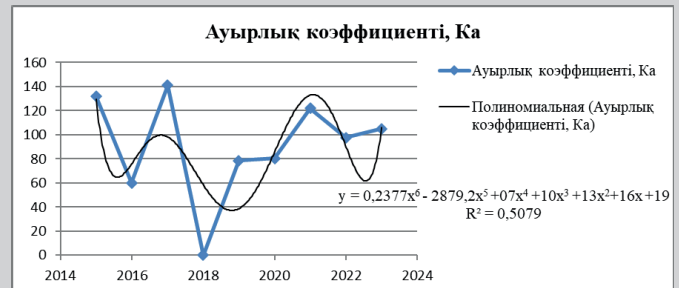
Сурет 3. Ауырлық коэффициентінің K_m(y) зерттеу уақытына T(x) тәуелділігінің графигі.

3-суретте зерттелетін кезеңдегі ауырлық коэффициентінің K_t бөліну функциясының графигі көрсетілген. Бұл сынған сызықтың аппроксимациясы аппроксимация коэффициентінің жуықтау R^2 = 0,5 шамасын береді, сондықтан бүкіл кезеңдегі K_t деректер нүктелерінің біркелкі еместігі туралы қорытынды жасауға болады. Жалпы, бұл функцияны бағалай отырып, 2015 және 2017 жылдардағы K_t -ның жалпы өсуін байқауға болады. Ауырлық коэффициентінің ең үлкен мәні 2017 жылы K_m = 141 және 2021 жылы K_m = 122 байқалды, зерттелетін кезең орташа мәні K_{m.cp} = 87,9 .