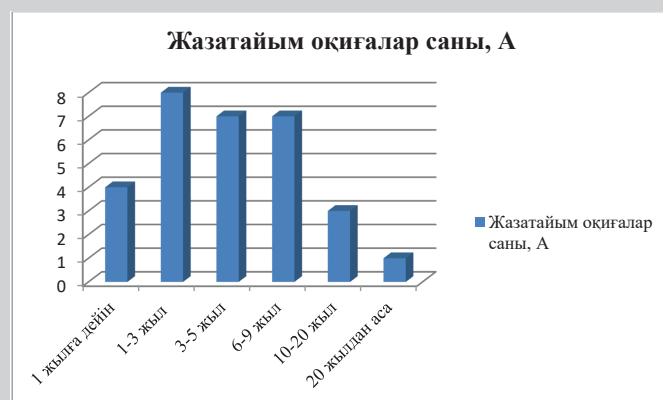
Сурет 6. 2015-2023 жж. кезеңінде зардап шеккендерді еңбек өтілі бойынша бөлудің истограммасы.

Figure 6. Histogram of the distribution of victims by length of service of employees in the period 2015-2023.