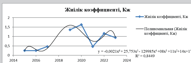
Сурет 2. Жиілік коэффициентінің K_f(y) зерттеу уақытына T(x) тәуелділік графигі.

Жиілік коэффициенті K_f бойынша тәуелділік (2-сурет) жазатайым оқиғалар санының бөліну тәуелділігіне өте ұқсас, жыл бойынша максимум мен минимумның шыңдары бірдей. Тәуелділіктің аппроксимациялау коэффициенті R^2 = 0,8449 , бұл сипатталған жиілік коэффициентінің K_f зерттелетін кезең уақытына тәуелділігінің дұрыстығын көрсетеді. Зерттелетін кезең үшін жиілік коэффициентінің орташа мәні K_{f.cp} = 0,72 [9].