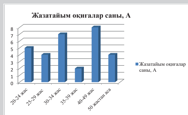
Сурет 5. 2015-2023 ж.ж. кезеңінде зардап шеккендерді жасына қарай бөлудің гистограммасы.

Кестеде келтірілген деректерді талдаудан келесідей қорытындылауға болады. Қызметкерлердің ең көп саны, атап айтқанда 27% және 23,3% «40-49» және «30-34 жас» санаттарына жатады. Бұл жұмысшылар, жұмыс өтіліне қарамастан, жарақаттануға ең бейім. Жарақаттануға бейімділігі бойынша үшінші орында «22-24 жас» жас санатындағы қызметкерлер тұр, олар жалпы санның 16,66% құрайды. «50 жастан жоғары» және «25-29» 13,3% құрайды. 1 жылдан 3 жылға дейінгі (27%) жұмыс өтілі бар жұмысшылар арасында 20-24 жас санатындағылардың (8 жағдайдың 4-і) жарақаттану ықтималдығы жоғары, 13,5% құрайды. Сондай-ақ, жарақаттанудың жоғары бейімділігі 3-5 жыл және 5-9 жыл жұмыс өтілі бар қызметкерлер арасында байқалады, бұл әр санат үшін 23,3% құрайды.