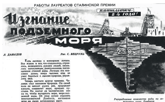
Рис. 1. Распределение количества воды по горизонтам шахт Донбасса.

Эффективное и повсеместное использование возможностей совместной эксплуатации стационарных установок шахт и их компонентов на практическом уровне мы наблюдаем в новейшей истории Советского Союза, во время и сразу после Великой Отечественной войны. В период восстановления взорванных и затопленных шахт откачка воды из них начиналась сразу после отступления немецко-фашистских захватчиков. Это масштабное событие в СССР, в основном на шахтах Донбасса, по существу и является, с нашей точки зрения, отправной точкой, или временем и местом рождения той ГМ, которую мы до сих пор настойчиво предлагаем основать [10], рис. 1 1 .